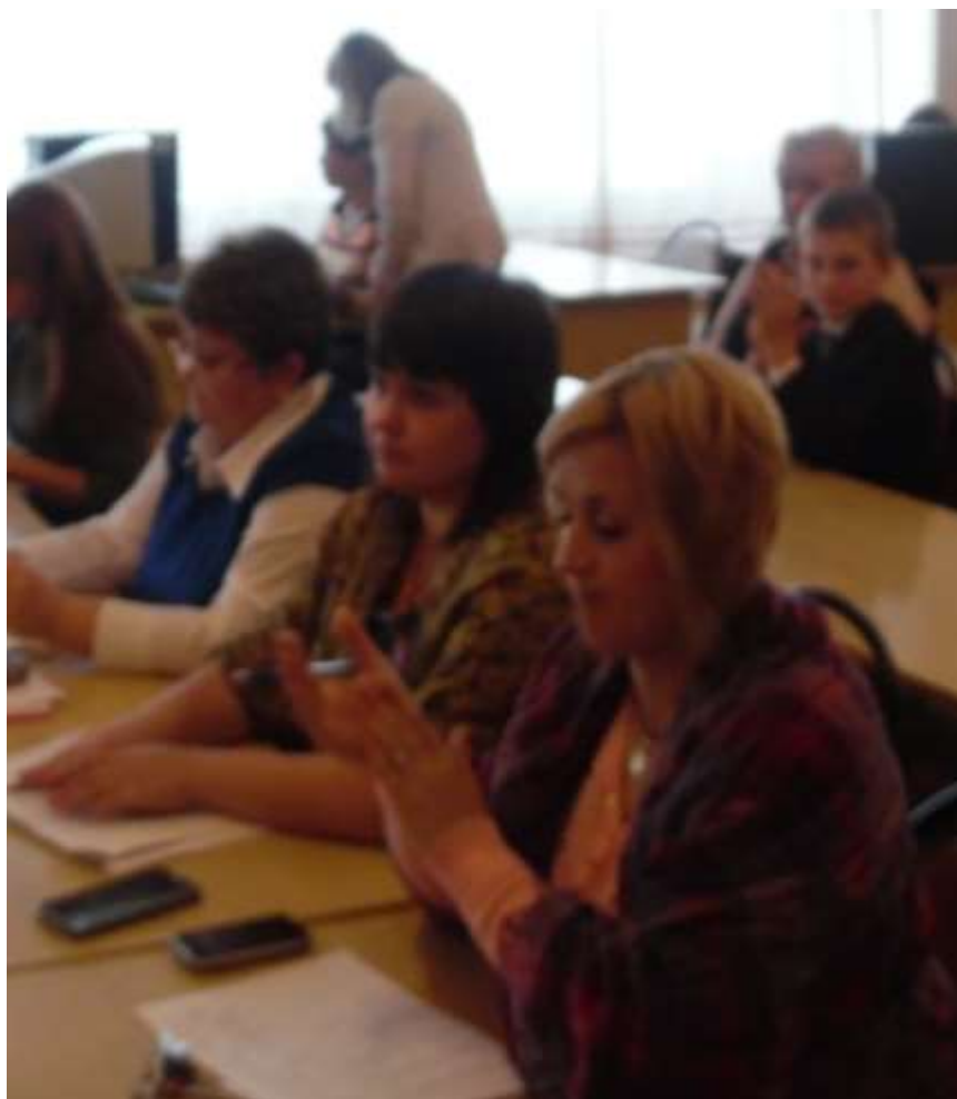
Подведение итогов конкурса «Живая классика»