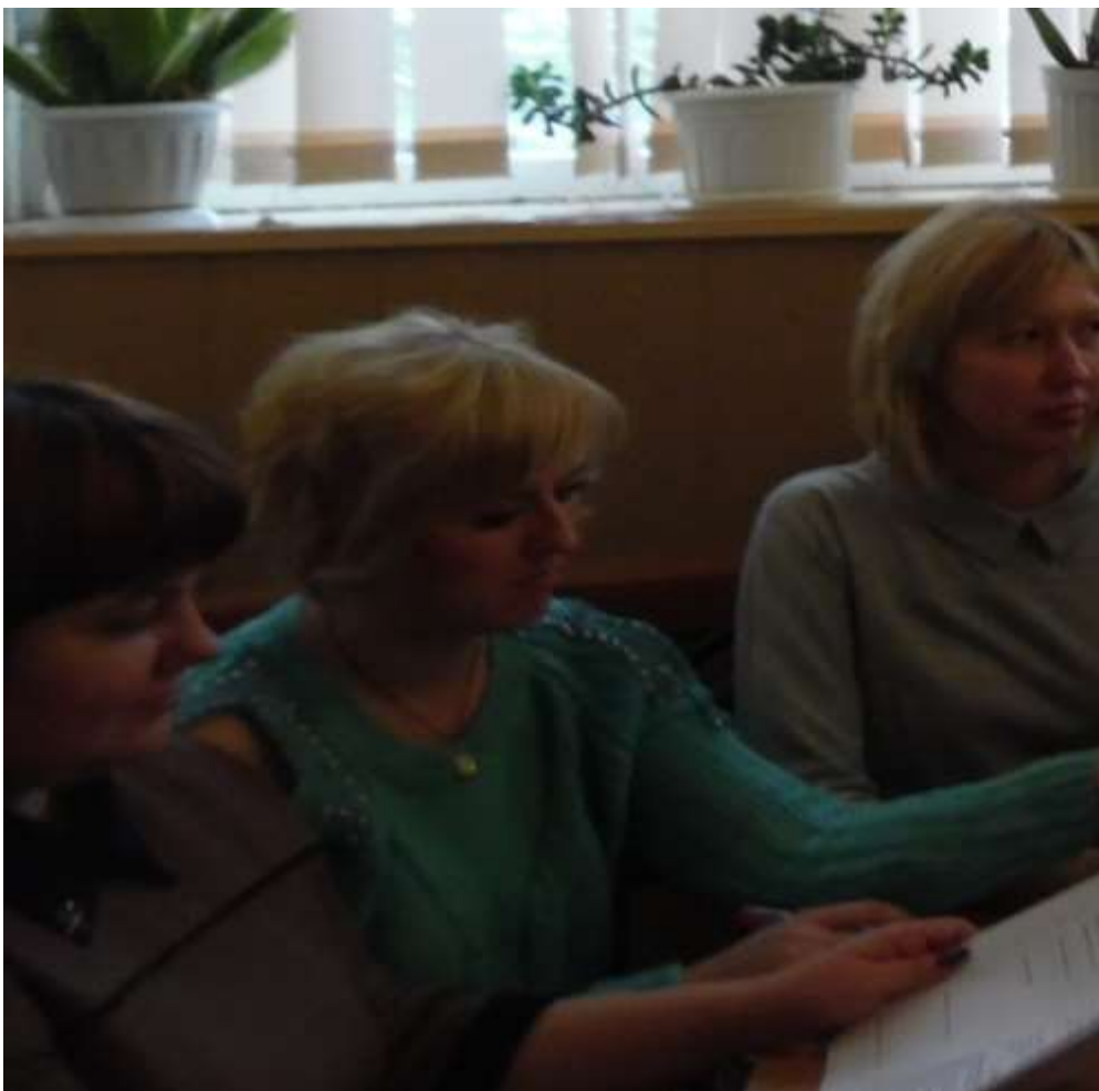
Рабочее совещание в редакции газеты «Истоки»