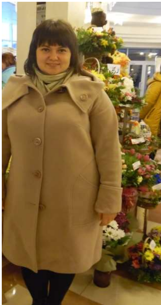
Областная выставка цветов