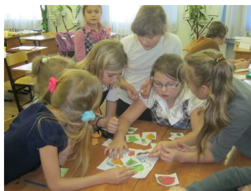
Конкурс загадок. Объединение «Лоскуток»- 3 группа