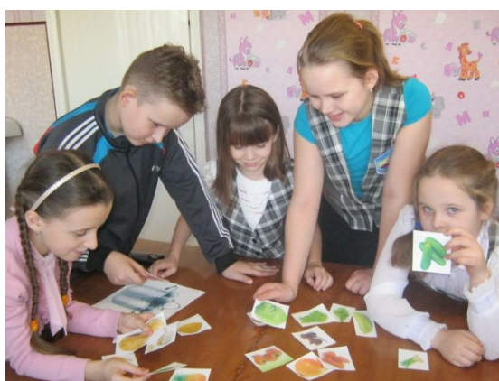
Конкурс загадок. Объединение «Лоскуток»-2 группа